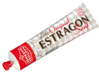
Bild 2: Klassiker und Liebling der Österreicher – Mautner Markhof Estragon Senf